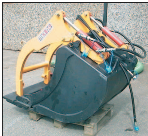
Klype på 400 liter skuffe