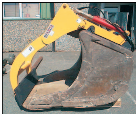
Klype på 1400 liter skuffe

MOI AS - Sertifisert produksjonsbedrift – med produksjon rettet mot anlegg, offshore -og jordbruks-utstyr. MOI GRIPEN – forhandleren vil normalt hjelpe deg. Ønsker du direkte kontakt med en representant fra MOI AS, ta kontakt på tlf. nr. 51 78 85 80.