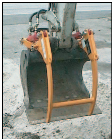
Klype på 55 liter skuffe